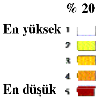
İllere Göre İGE Değerlerinin % 20'lik Dilimlerle Dağılımı, 1997

Ayrıştırılmış yaklaşım, Türkiye'de insani gelişme dinamikleri açısından